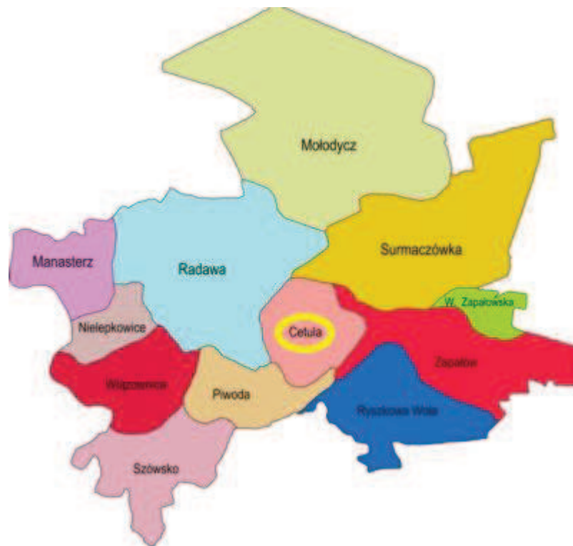
Rysunek 3. Lokalizacja miejscowości Cetula w gminie Wiązownica

Cetula jest jednym z 12 sołectw wyodrębnionych w podziale terytorialnym Gminy Wiązownica, położona w jej południowej części. Wieś zajmuje obszar o powierzchni 1 287,20 ha, co stanowi 5,27 % powierzchni gminy. Cetula liczy 548 stałych mieszkańców.