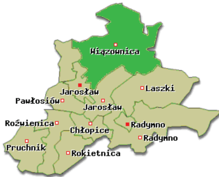
Rysunek 2. Gmina Wiązownica na tle powiatu jarosławskiego

Cetula jest jednym z 12 sołectw wyodrębnionych w podziale terytorialnym Gminy Wiązownica, położona w jej południowej części. Wieś zajmuje obszar o powierzchni 1 287,20 ha, co stanowi 5,27 % powierzchni gminy. Cetula liczy 548 stałych mieszkańców.